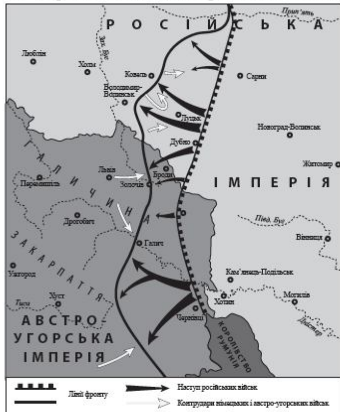
Брусиловського прориву (1916 р.)

військові події на території України в 1914–1916 роках